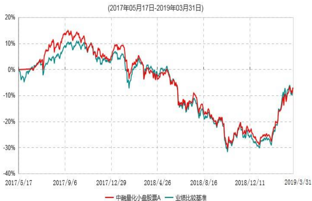
中融量化小盘股票A累计净值增长率与业绩比较基准收益率历史走势对比图