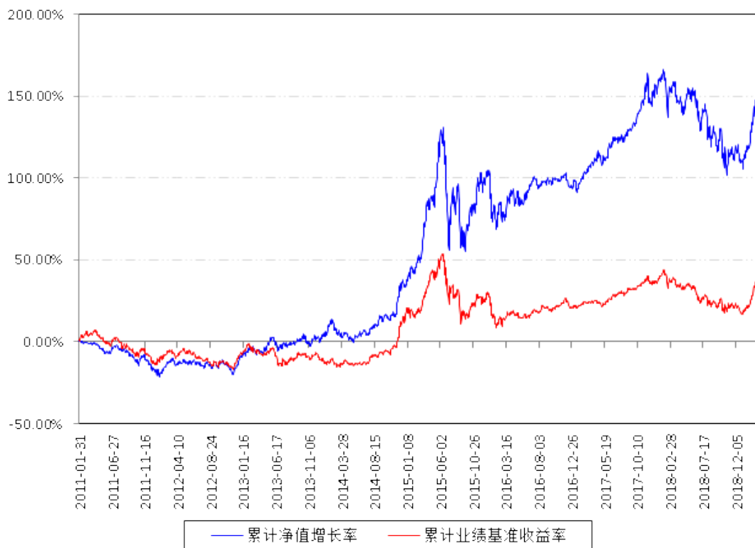
南方优选成长A累计净值增长率与同期业绩比较基准收益率的历史走势对比图