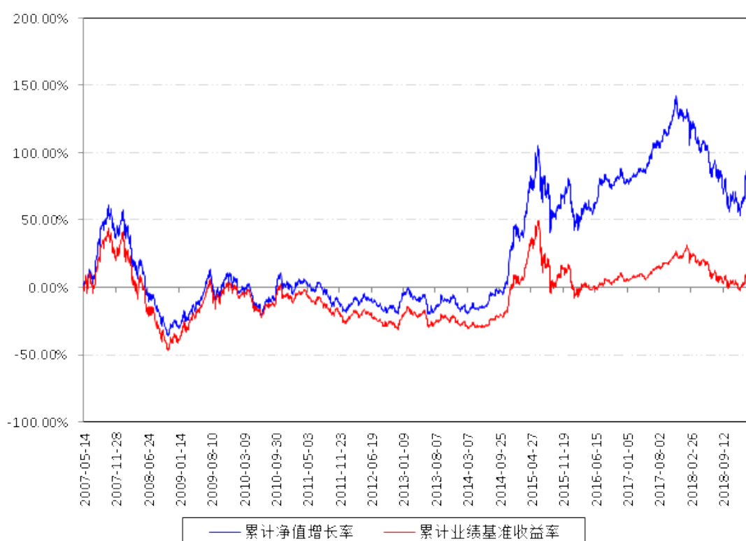
南方成份A累计净值增长率与同期业绩比较基准收益率的历史走势对比图