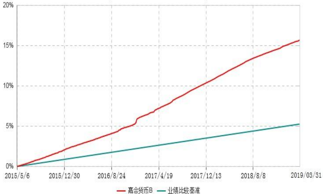
嘉合货币B累计净值收益率与业绩比较基准收益率历史走势对比图 (2015年05月06日-2019年03月31日)