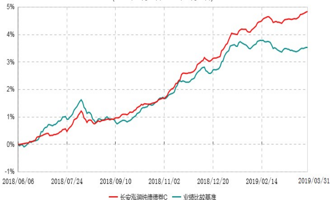
长安泓润纯债债券C累计净值增长率与业绩比较基准收益率历史走势对比图 (2018年06月06日-2019年03月31日)

根据基金合同的规定，自基金合同生效日起 6 个月内基金各项资产配置比例需符合基金合同要求。本基金在建仓期结束后，各项资产配置比例已符合基金合同有关投资比例的约定。基金合同生效日至报告期末，本基金运作时间未满一年。图示日期为 2018 年 06 月 06 日至 2019 年 03 月 31 日。