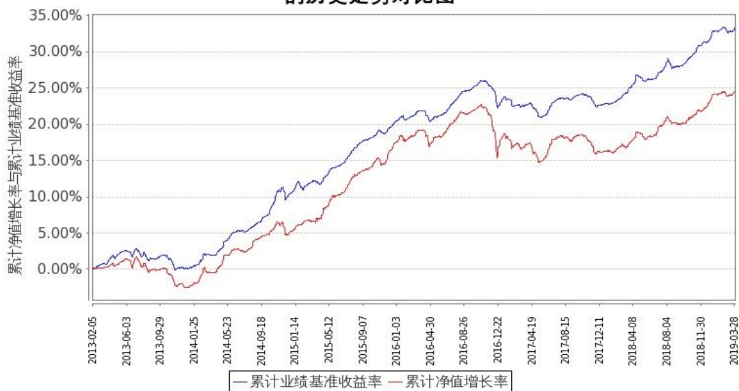
图 2：嘉实中证中期企业债指数（LOF）C 基金份额累计净值增长率与同期业绩比较基准收益率的历史走势对比图