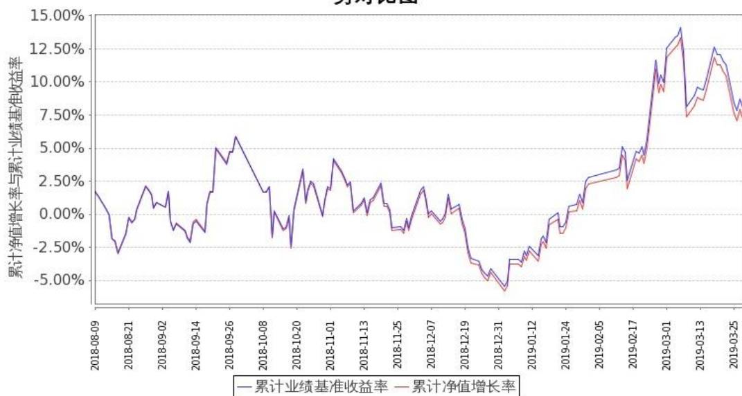
图 2: 嘉实基本面 50 指数 (LOF) C 基金份额累计净值增长率与同期业绩比较基准收益率的历史走势对比图