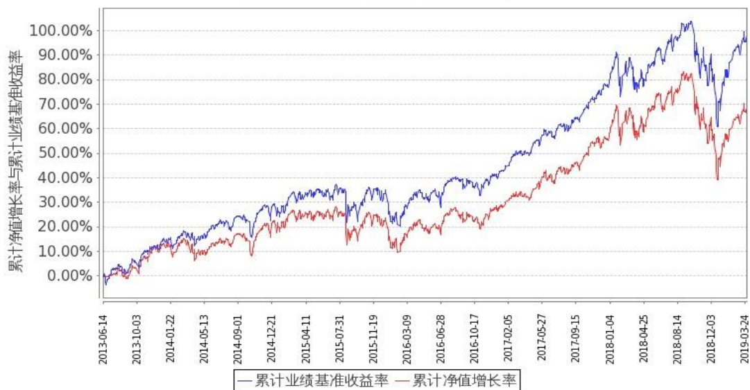
图 2：嘉实美国成长股票型证券投资基金-美元现汇基金份额累计净值增长率与同期业绩比较基准收益率的历史走势对比图