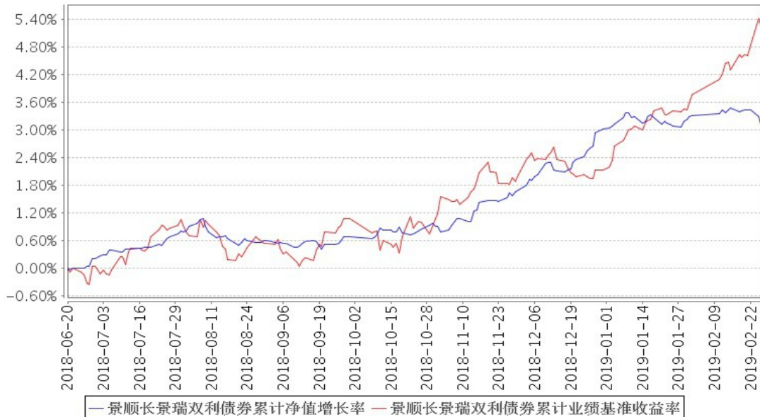
景顺长城景瑞双利债券累计净值增长率与同期业绩比较基准收益率的历史走势对比图

注：因景顺长城景瑞双利定期开放债券型证券投资基金（以下简称“景瑞双利定期开放债券基金”）触发基金合同约定的转型条款，该基金自 2018 年 6 月 20 日转型为景顺长城景瑞双利债券型证券投资基金（以下简称“景瑞双利债券基金”）。