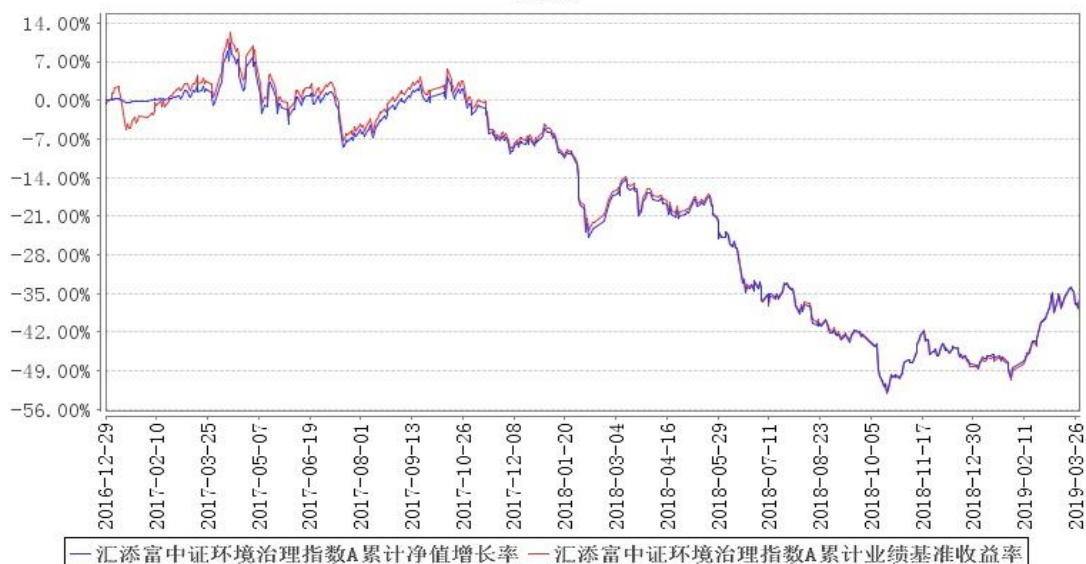
汇添富中证环境治理指数A累计净值增长率与同期业绩比较基准收益率的历史走势对比图