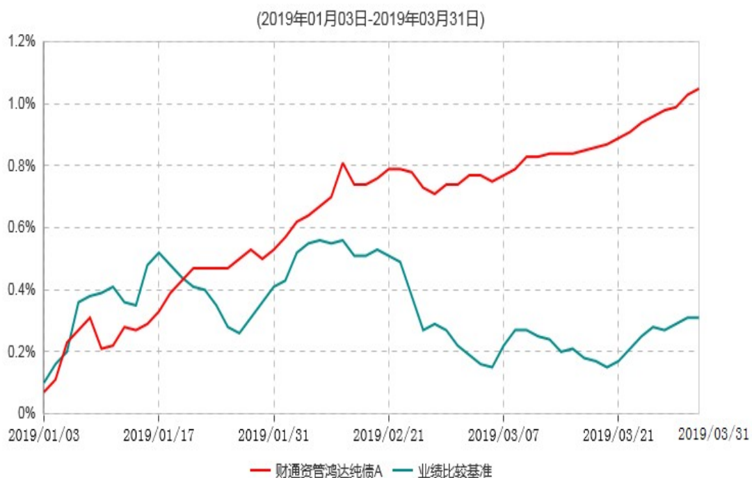
财通资管鸿达纯债A累计净值增长率与业绩比较基准收益率历史走势对比图