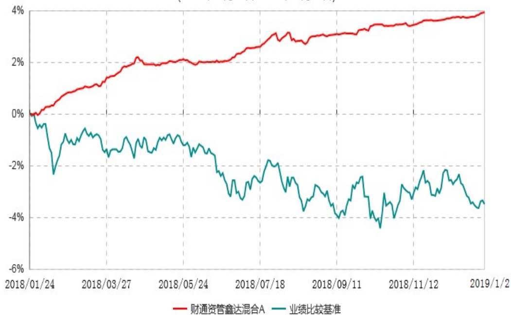
财通资管鑫达混合C累计净值增长率与业绩比较基准收益率历史走势对比图