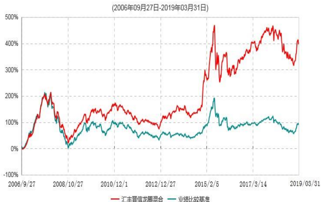
汇丰晋信龙腾混合型证券投资基金累计净值增长率与业绩比较基准收益率历史走势对比图

注：1.按照基金合同的约定，本基金的投资组合比例为：股票占基金资产的60%-95%；除股票以外的其他资产占基金资产的5%-40%，其中现金或到期日在一年期以内的国债的比例合计不低于基金资产净值的5%。本基金自基金合同生效日起不超过6个月内完成建仓。截止2007年3月27日，本基金的各项投资比例已达到基金合同约定的比例。