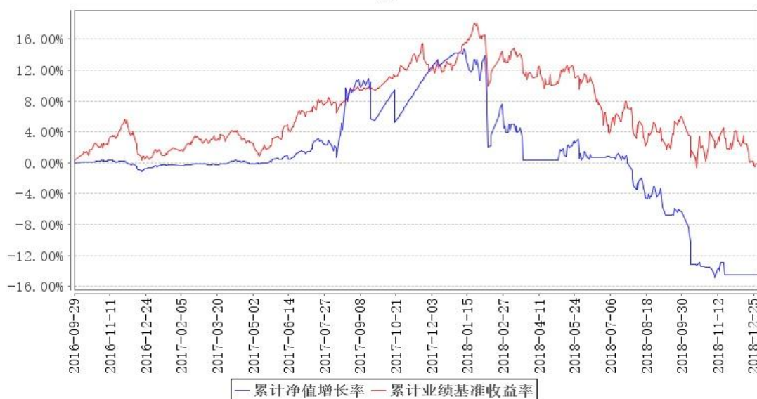
大成景禄灵活配置混合C累计净值增长率与同期业绩比较基准收益率的历史走势对比图

注:本基金合同规定,基金管理人应当自基金合同生效之日起六个月内使基金的投资组合比例符合基金合同的约定。建仓期结束时,本基金的投资组合比例符合基金合同的约定。