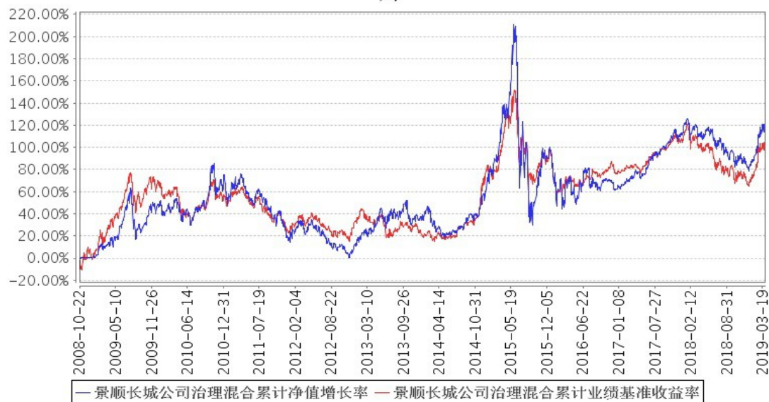
景顺长城公司治理混合累计净值增长率与同期业绩比较基准收益率的历史走势对比图

注：本基金的资产配置比例为：股票投资 65%–95%，债券投资 0%–30%，现金或者到期日在一年以内的政府债券投资 5%–35%，权证投资 0%–3%。本基金投资于基金名称显示投资方向的股票不低于基金股票投资的 80%；本基金自 2008 年 10 月 22 日合同生效日起至 2009 年 4 月