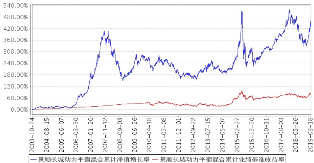
景顺长城动力平衡混合累计净值增长率与同期业绩比较基准收益率的历史走势对比图

注：本基金的资产配置比例为：股票投资的比例为基金资产净值的 20%至 80%；债券投资的比例为基金资产净值的 20%至 80%。按照本系列基金基金合同的规定，本基金自 2003 年 10 月 24 日合同生效日起至 2004 年 1 月 23 日为建仓期。本基金于 2007 年 9 月 10 日实施分红，此后基金资产规模持续增长，根据基金部函[2007]91 号《关于实施基金份额拆分后调整基金建仓期有关问题的复函》的有关规定，本基金证券投资比例的调整期限延长至 2007 年 10 月 9 日止。建仓期结束时，本基金投资组合均达到上述投资组合比例的要求。