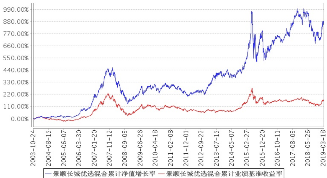
景顺长城优选混合累计净值增长率与同期业绩比较基准收益率的历史走势对比图

注：本基金的资产配置比例为：股票投资的比例为基金资产净值的70%至80%；债券投资的比例为基金资产净值的20%至30%。按照本系列基金基金合同的规定，本基金自2003年10月24日合同生效日起至2004年1月23日为建仓期。建仓期结束时，本基金投资组合均达到上述投资组合比例的要求。自2017年9月6日起，本基金业绩比较基准由“上证综合指数和深证综合指数的加权复合指数×80%+中国债券总指数×20%”调整为“中证