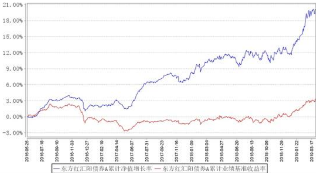
东方红汇阳债券A累计净值增长率与同期业绩比较基准收益率的历史走势对比图

2、自基金合同生效以来基金累计净值增长率变动及其与同期业绩比较基准收益率变动的比较