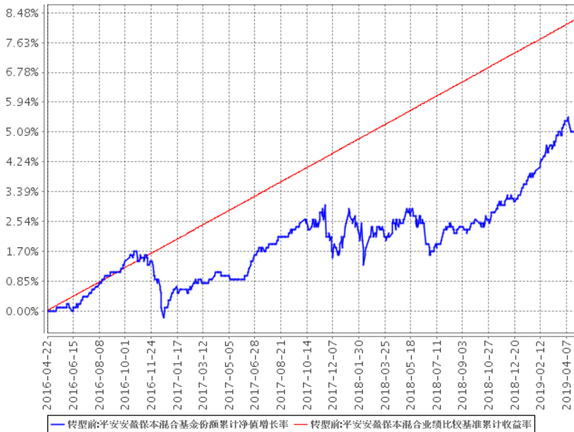
平安安盈保本混合基金份额累计净值增长率与同期业绩比较基准收益率的历史走势对比图