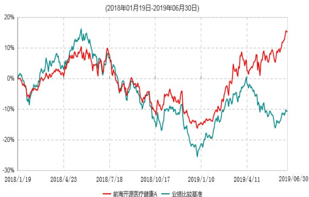
前海开源医疗健康A累计净值增长率与业绩比较基准收益率历史走势对比图