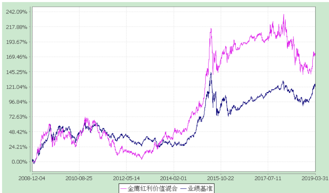
金鹰红利价值灵活配置混合型证券投资基金 累计净值增长率与业绩比较基准收益率历史走势对比图 (2008 年 12 月 4 日至 2019 年 3 月 31 日)