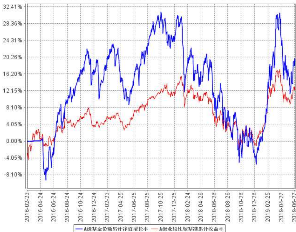
A 级基金份额累计净值增长率与同期业绩比较基准收益率的历史走势对比图