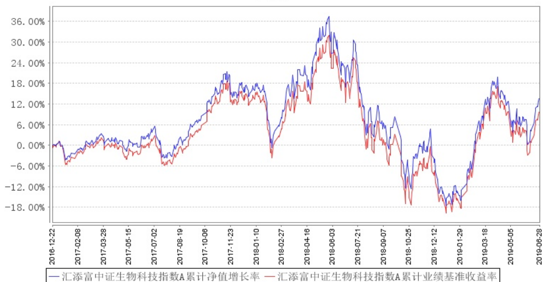
汇添富中证生物科技指数A累计净值增长率与同期业绩比较基准收益率的历史走势对比图