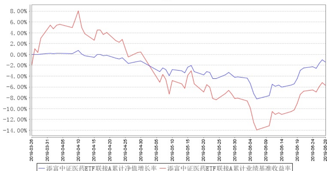
添富中证医药ETF联接A累计净值增长率与同期业绩比较基准收益率的历史走势对比图