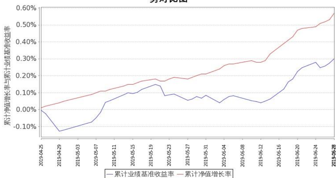
图 1：嘉实中债 1-3 政金债指数 A 基金份额累计净值增长率与同期业绩比较基准收益率的历史走势对比图