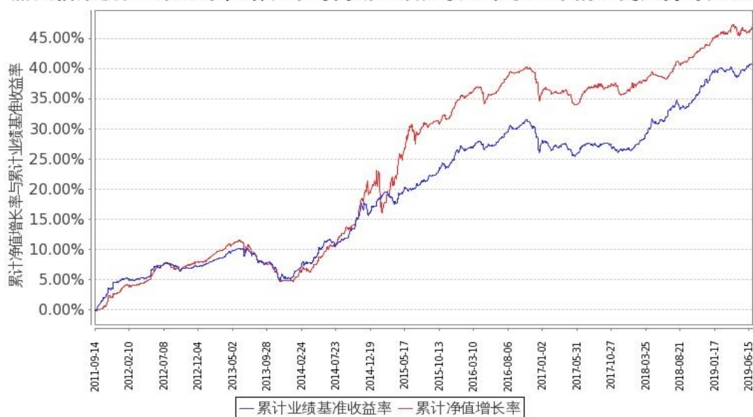
图 2: 嘉实信用债券 C 基金份额累计净值增长率与同期业绩比较基准收益率的历史走势对比图 (2011 年 9 月 14 日至 2019 年 6 月 30 日)

注：按基金合同和招募说明书的约定，本基金自基金合同生效日起 6 个月内为建仓期，建仓期结束时本基金的各项投资比例符合基金合同（十四（二）投资范围和（七）投资禁止行为与限制 2. 基金投资组合比例限制）的有关约定。