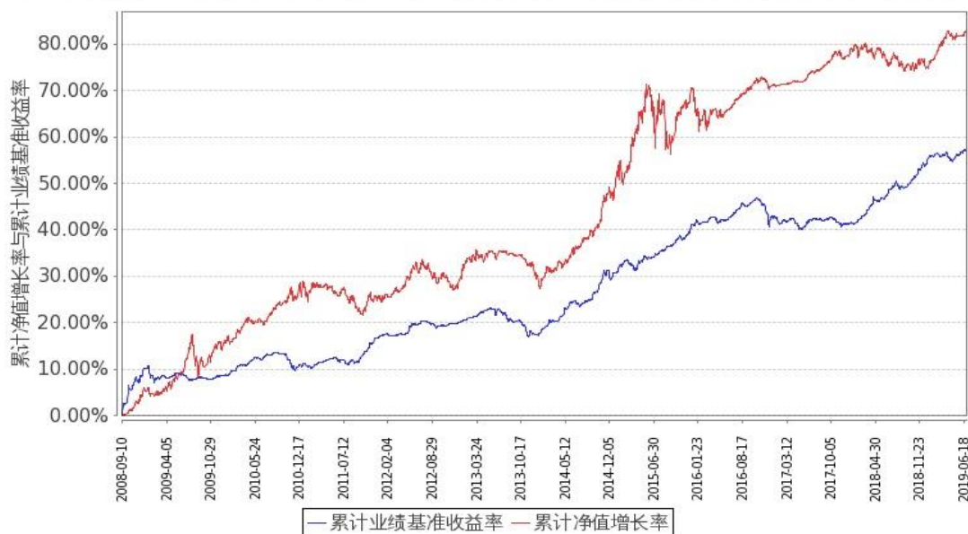
图 1: 嘉实多元债券 A 基金份额累计净值增长率与同期业绩比较基准收益率的历史走势对比图 (2008 年 9 月 10 日至 2019 年 6 月 30 日)