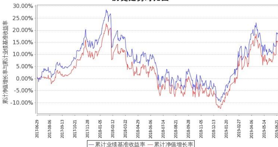
图 1：嘉实富时中国 A50ETF 联接基金 A 类基金份额累计净值增长率与同期业绩比较基准收益率的历史走势对比图