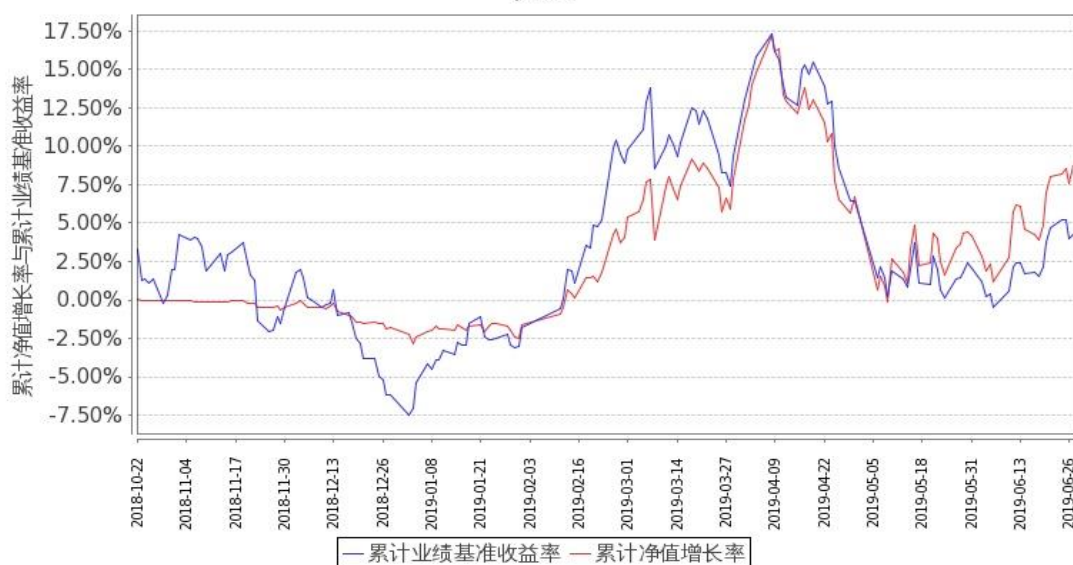
嘉实资源精选股票 C 累计净值增长率与同期业绩比较基准收益率的历史走势对比图