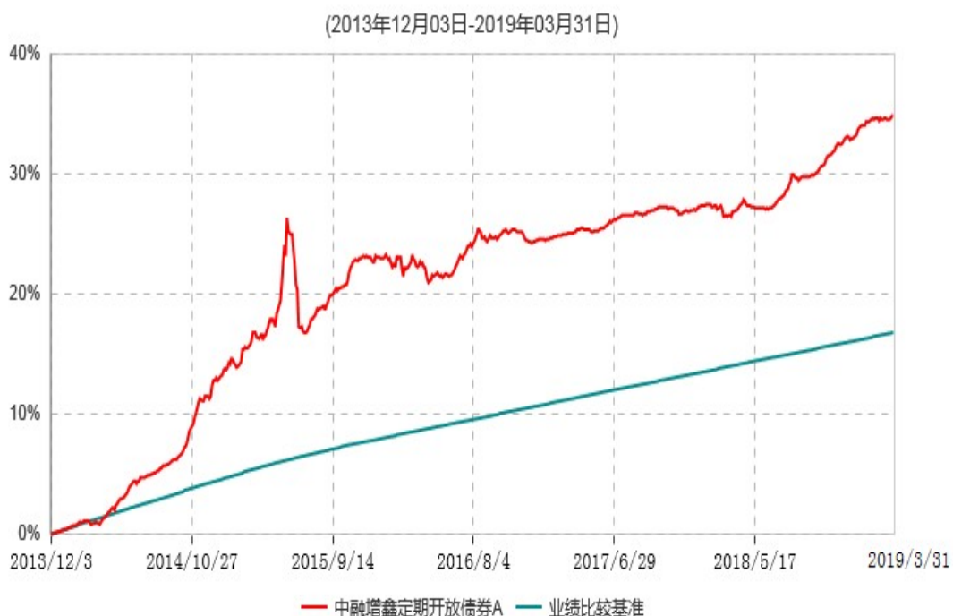
中融增鑫定期开放债券A累计净值增长率与业绩比较基准收益率历史走势对比图