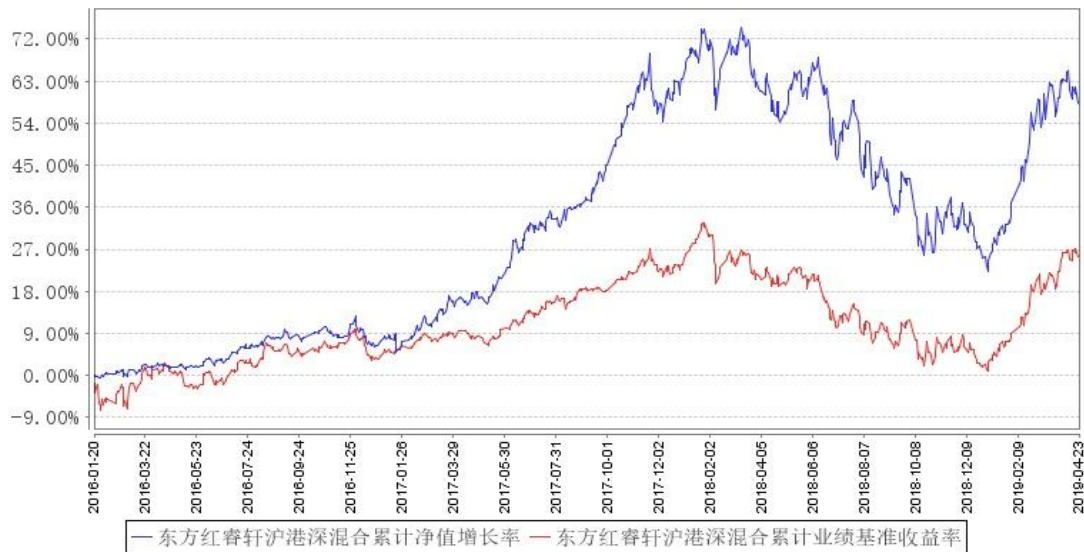
东方红睿轩沪港深混合累计净值增长率与同期业绩比较基准收益率的历史走势对比图