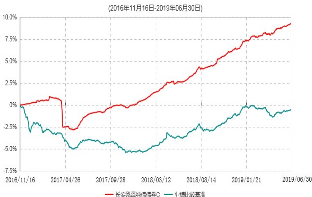
长安泓泽纯债债券C累计净值增长率与业绩比较基准收益率历史走势对比图

本基金基金合同生效日为 2016 年 11 月 16 日，按基金合同规定，本基金自基金合同生效起 6 个月为建仓期，截止到建仓期结束时，本基金的各项投资组合比例已符合基金合同的相关规定。基金合同生效日至报告期期末，本基金运作时间已满一年，图示日期为 2016 年 11 月 16 日至 2019 年 6 月 30 日。