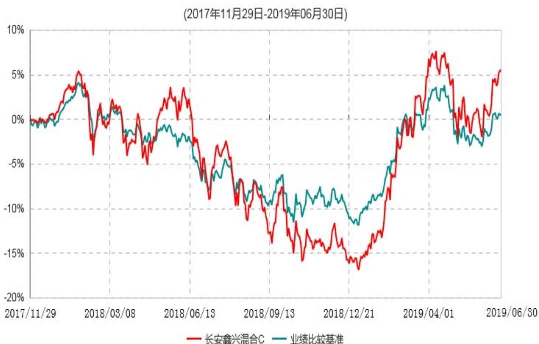
长安鑫兴混合C累计净值增长率与业绩比较基准收益率历史走势对比图

根据基金合同的规定,自基金合同生效之日起6个月内基金各项资产配置比例需符合基金合同要求。截止到建仓期结束时,本基金的各项投资组合比例已符合基金合同的相关规定。基金合同生效日至报告期期末,本基金运作时间已满一年。图示日期为2017年11月29日至2019年6月30日。