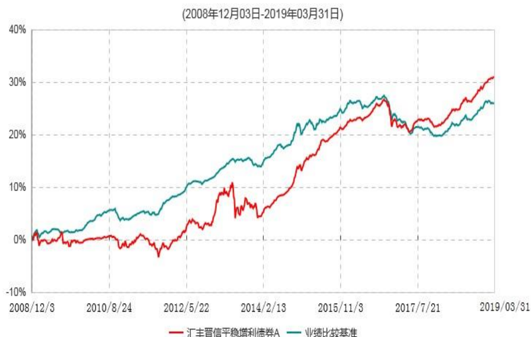
汇丰晋信平稳增利债券A累计净值增长率与业绩比较基准收益率历史走势对比图

注：1. 按照基金合同的约定，本基金主要投资于具有较高息票率的债券品种，包括国债、企业债、公司债、短期融资券、资产支持证券(含资产收益计划)、可转换债券等，投资比例不低于基金资产的 80%，现金或者到期日在一年以内的政府债券不低于基金资产净值的 5%。按照基金合同的约定，本基金自基金合同生效日起不超过 6 个月内完成建仓，截止 2009 年 6 月 3 日，本基金的各项投资比例已达到基金合同约定的比例。