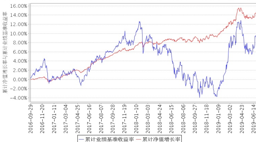
安信新成长混合A累计净值增长率与同期业绩比较基准收益率的历史走势对比图