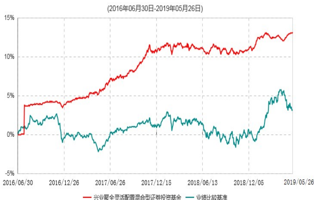
兴业聚全灵活配置混合型证券投资基金累计净值增长率与业绩比较基准收益率历史走势对比图

1、本报告期内，兴业聚全灵活配置混合型证券投资基金自2019年4月30日起至2019年5月26日以通讯方式召开基金份额持有人大会，于2019年5月27日表决通过了《关于兴业聚全灵活配置混合型证券投资基金转型为兴业中债1-3年政策性金融债指数证券投资基金有关事项的议案》。根据基金份额持有人大会决议，兴业聚全灵活配置混合型证券投资基金正式转型为兴业中债1-3年政策性金融债指数证券投资基金，本次大会决议自2019年5月27日生效。详见基金管理人在指定媒介发布的公告。