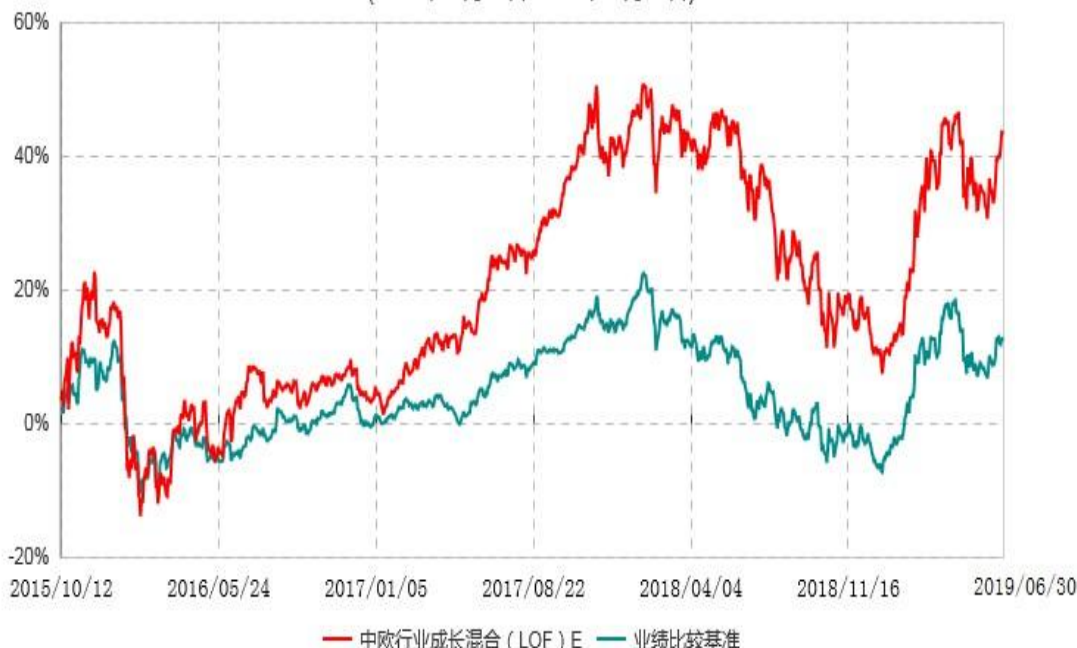
中欧行业成长混合(LOF)E累计净值增长率与业绩比较基准收益率历史走势对比图 (2015年10月12日-2019年06月30日)

注：本基金自2015年10月8日新增E类份额，图示日期为2015年10月12日至2019年06月30日。