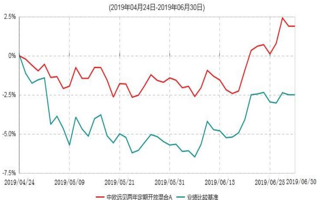
中欧远见两年定期开放混合A累计净值增长率与业绩比较基准收益率历史走势对比图

注：本基金基金合同生效日期为 2019 年 04 月 24 日，自基金合同生效日起到本报告期末不满一年，按基金合同的规定，本基金自基金合同生效起六个月为建仓期，建仓期结束时各项资产配置比例应当符合基金合同约定。