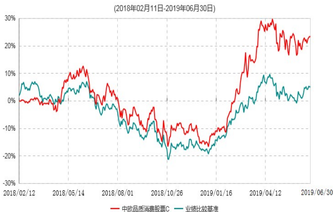
中欧品质消费股票C累计净值增长率与业绩比较基准收益率历史走势对比图

注：本基金基金合同生效日期为 2018 年 2 月 11 日，按基金合同的规定，本基金自基金合同生效起六个月为建仓期，建仓期结束时各项资产配置比例已符合基金合同约定。