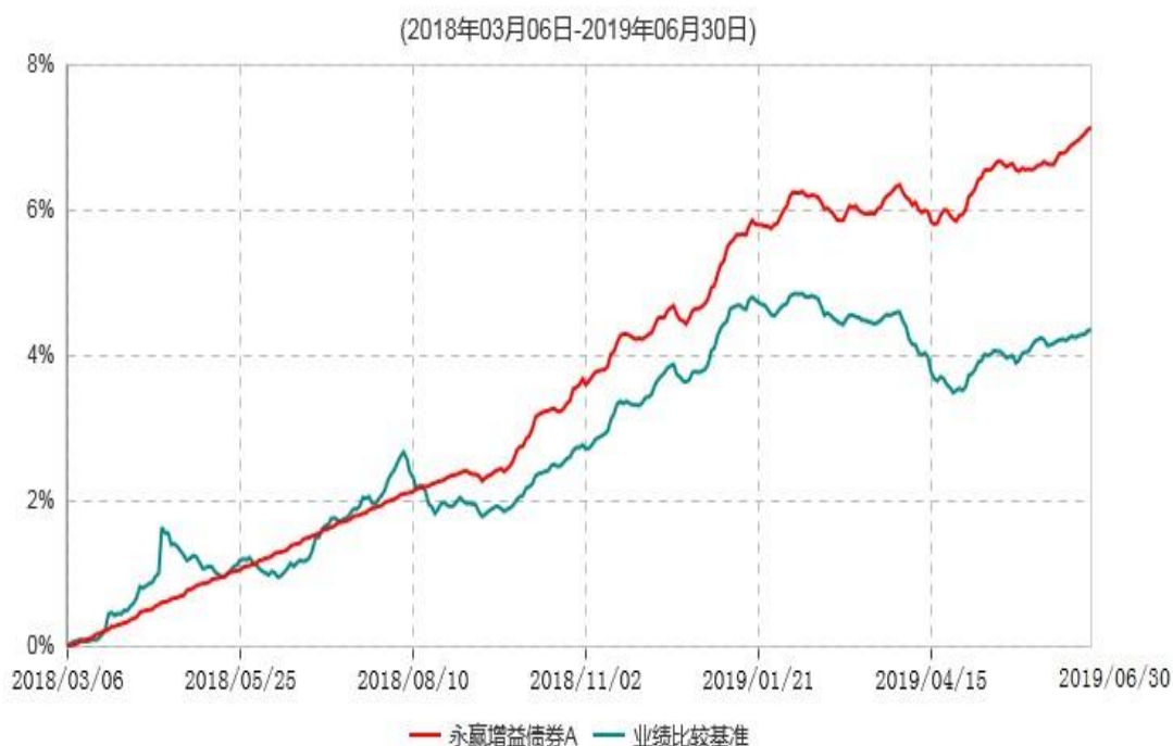
永赢增益债券A累计净值增长率与业绩比较基准收益率历史走势对比图

注：1、本基金建仓期为本基金合同生效日起 6 个月，建仓期结束当日，除债券投资比例未达到合同约定外，其他各项资产配置符合合同约定。债券投资比例未达到合同约定系交易对手原因导致现券买入交易结算失败所致，本基金于 2018 年 9 月 6 日及时买入债券将债券投资比例提高至合同约定的范围内。