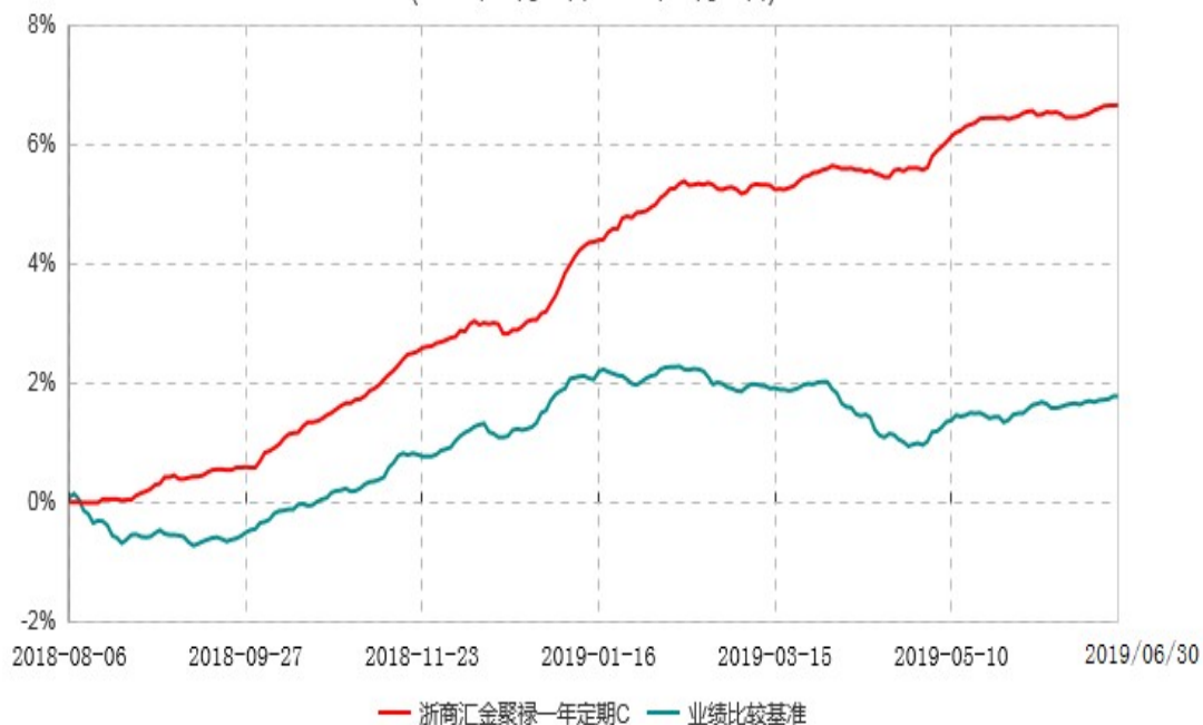
浙商汇金聚禄一年定期C累计净值增长率与业绩比较基准收益率历史走势对比图 (2018年08月06日-2019年06月30日)

注：本基金合同生效日为 2018 年 8 月 6 日，自合同生效日期至本报告期末不足一年。至本报告期末，本基金建仓期已完成建仓但报告期末距建仓结束不满一年。本基金建仓期结束时各项资产配置比例符合基金合同约定。