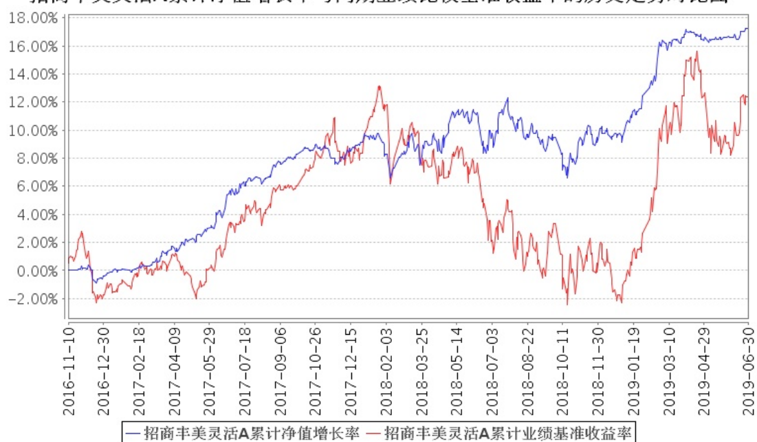
招商丰美灵活A累计净值增长率与同期业绩比较基准收益率的历史走势对比图