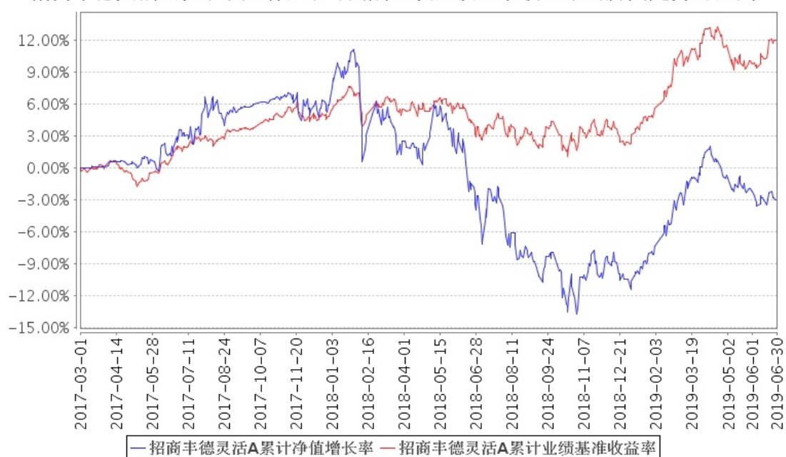
招商丰德灵活A累计净值增长率与同期业绩比较基准收益率的历史走势对比图