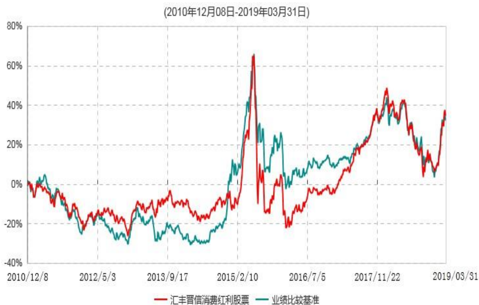
汇丰晋信消费红利股票型证券投资基金累计净值增长率与业绩比较基准收益率历史走势对比图

注：1.按照基金合同的约定，本基金的投资组合比例为：股票投资比例范围为基金资产的 85%-95%，权证投资比例范围为基金资产净值的 0%-3%。固定收益类证券、现金和其他资产投资比例范围为基金资产的 5%-15%，其中现金（不包括结算备付金、存出保证金、应收申购款等）或到期日在一年以内的政府债券的投资比例不低于基金资产净值的 5%。按照基金合同的约定，本基金自基金合同生效日起不超过 6 个月内完成建仓，截止 2011 年 6 月 8 日，本基金的各项投资比例已达到基金合同约定的比例。