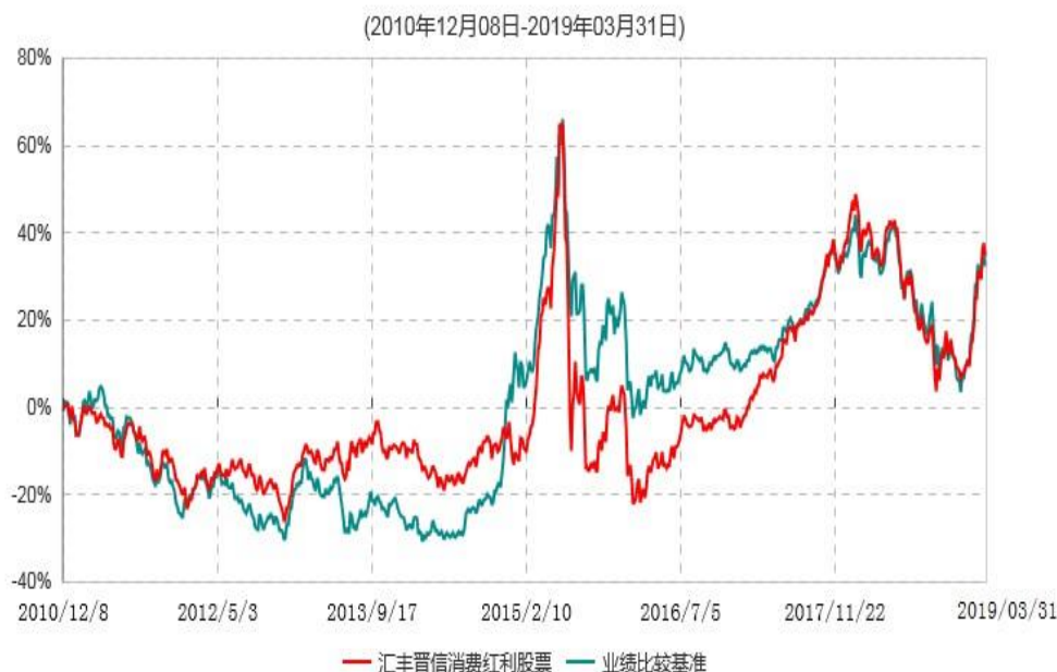
汇丰晋信消费红利股票型证券投资基金累计净值增长率与业绩比较基准收益率历史走势对比图

注：1.按照基金合同的约定，本基金的投资组合比例为：股票投资比例范围为基金资产的85%-95%，权证投资比例范围为基金资产净值的0%-3%。固定收益类证券、现金和其他资产投资比例范围为基金资产的5%-15%，其中现金（不包括结算备付金、存出保证金、应收申购款等）或到期日在一年以内的政府债券的投资比例不低于基金资产净值的5%。按照基金合同的约定，本基金自基金合同生效日起不超过6个月内完成建仓，截止2011年6月8日，本基金的各项投资比例已达到基金合同约定的比例。