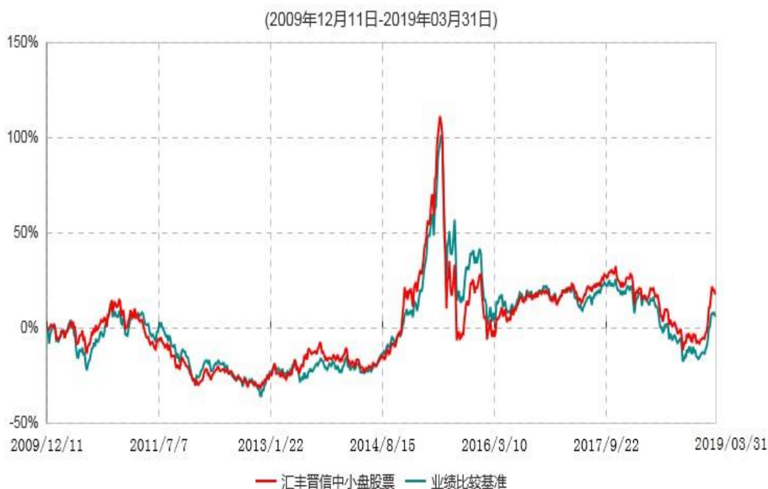
汇丰晋信中小盘股票型证券投资基金累计净值增长率与业绩比较基准收益率历史走势对比图

注：1. 按照基金合同的约定，本基金的股票投资比例范围为基金资产的 85%-95%，其中，将不低于 80%的股票资产投资于国内 A 股市场上具有良好成长性和基本面良好的中小上市公司股票。本基金权证投资比例范围为基金资产净值的 0%-3%。本基金固定收益类证券和现金投资比例范围为基金资产的 5%-15%，其中现金（不包括结算备付金、存出保证金、应收申购款等）或到期日在一年以内的政府债券的投资比例不低于基金资产净值的 5%。按照基金合同的约定，本基金自基金合同生效日起不超过 6 个月内完成建仓，截止 2010 年 6 月 11 日，本基金的各项投资比例已达到基金合同约定的比例。