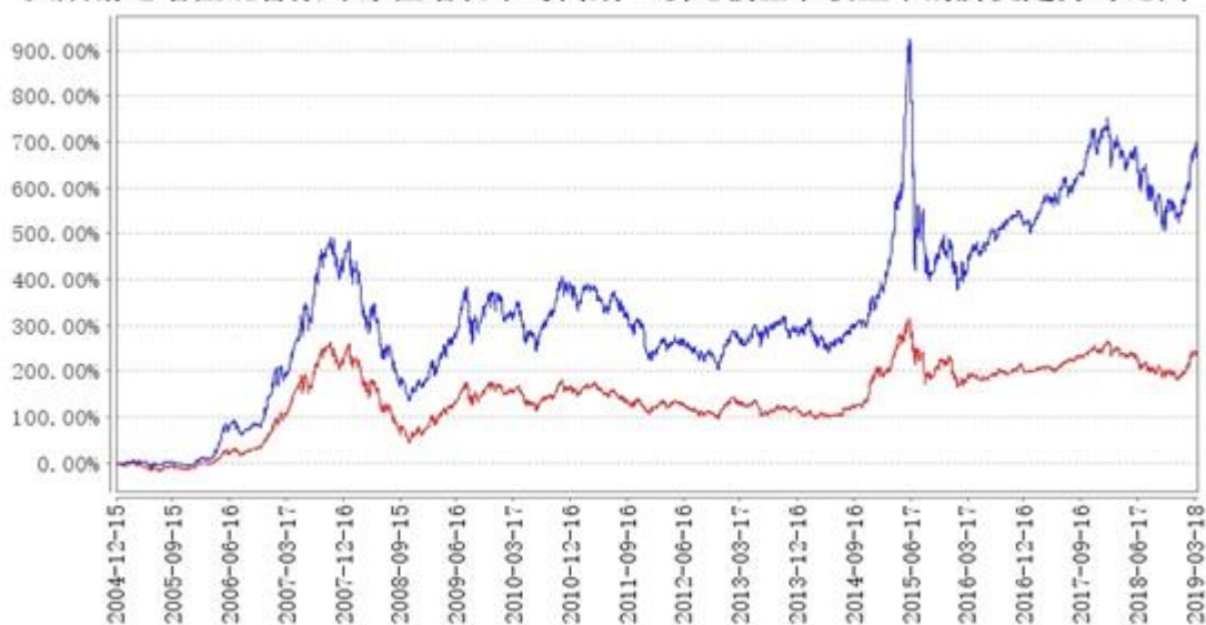
大成精选增值混合累计净值增长率与同期业绩比较基准收益率的历史走势对比图

注：1、本基金合同约定，基金经理应在自基金合同生效之日起六个月内使基金的投资组合比例符合基金合同的约定。建仓期结束时，本基金的投资组合比例符合基金合同的约定。