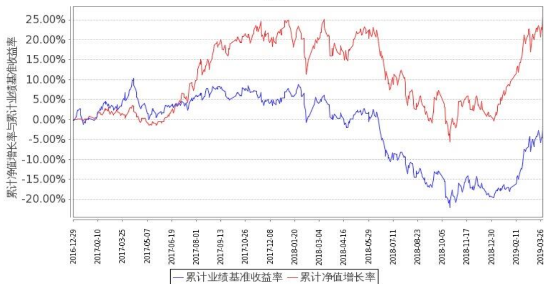
图 1：嘉实物流产业股票 A 基金累计份额净值增长率与同期业绩比较基准收益率的历史走势对比图