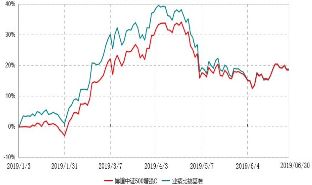
博道中证500增强C累计净值增长率与业绩比较基准收益率历史走势对比图 (2019年01月03日-2019年06月30日)

注：本基金基金合同生效日为 2019 年 1 月 3 日，基金合同生效日至报告期期末，本基金运作时间未满一年。本基金建仓期为自基金合同生效日起的 6 个月。截至 2019 年 6 月 30 日，本基金尚处于建仓期。