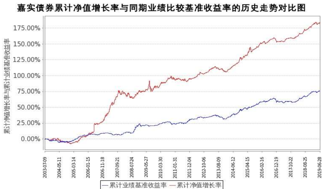
图：嘉实债券份额累计净值增长率与同期业绩比较基准收益率的历史走势对比图