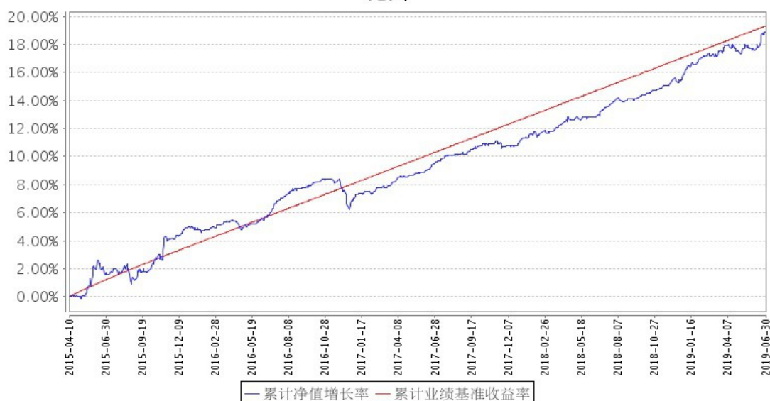
景顺长城稳健回报混合A累计净值增长率与同期业绩比较基准收益率的历史走势对比图