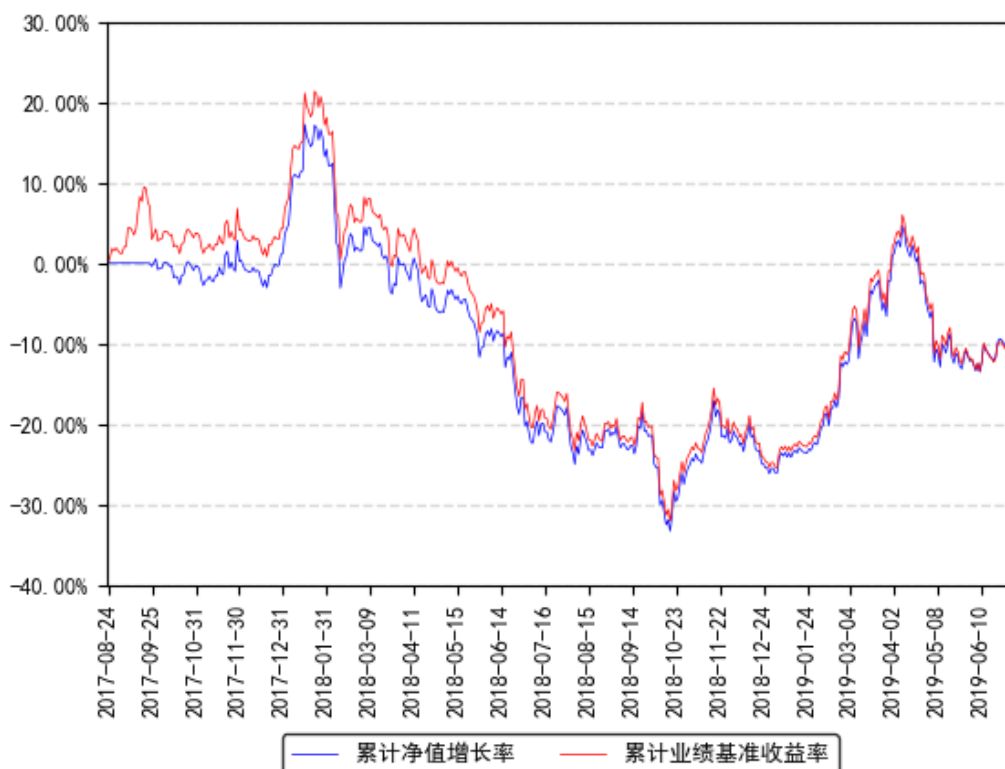
南方房地产联接A累计净值增长率与同期业绩比较基准收益率的历史走势对比图